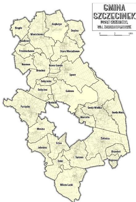
Rys. 2 Podział gminy Szczecinek na jednostki analityczne