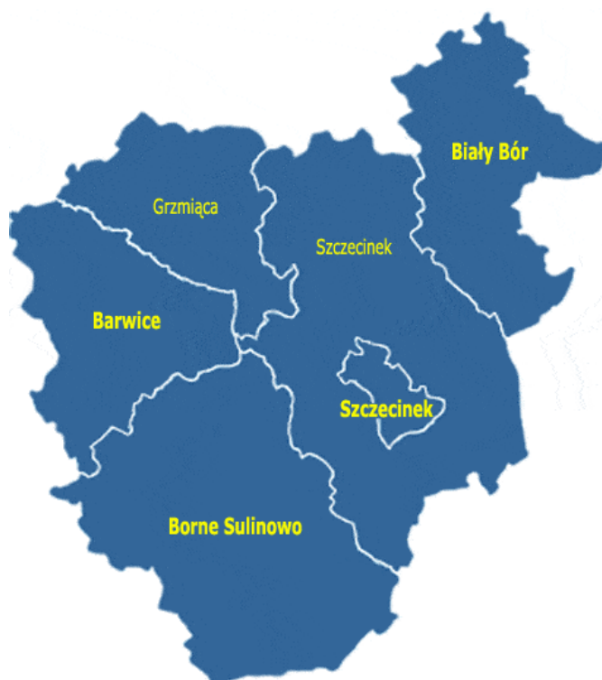
Rys. 1 Położenie gminy Szczecinek na tle powiatu szczecineckiego.

Gmina Szczecinek położona jest w środkowo wschodniej części województwa zachodniopomorskiego. Od strony północnej gmina graniczy z Gminą Bobolice od zachodu z Gminą Borne Sulinowo i Grzmiąca, od południa z gminą Złotów i Człuchów, a od wschodu z Gminą Biały Bór. Gmina otacza również gminę miejską Szczecinek.